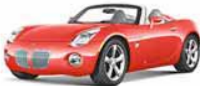
Aggressive Victory Red