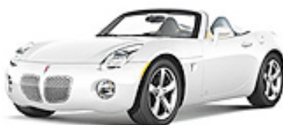
Pure Summit White