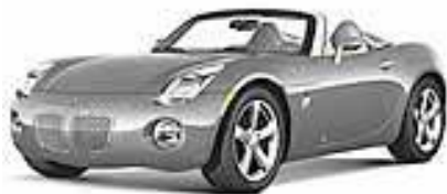
Sly Shadow Gray met.