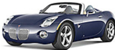
Deep Dark Blue met.