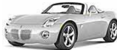
Cool Liquid Silver met.