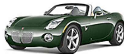
Envious Emerald Green met.