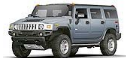
Slate Blue met.