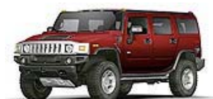
Twilight Maroon met.