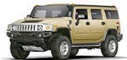
Dessert Sand met.