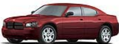
Inferno Red Crystal Pearl