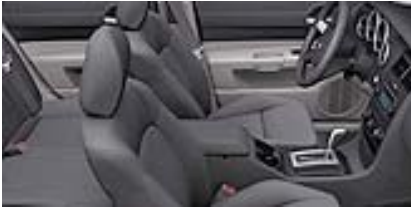
Dark/Light Slate Gray, Stoff