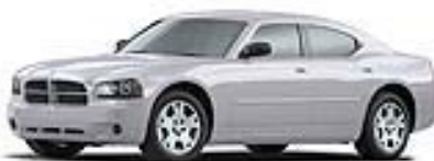
Bright Silver met.