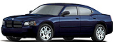
Midnight Blue Pearl