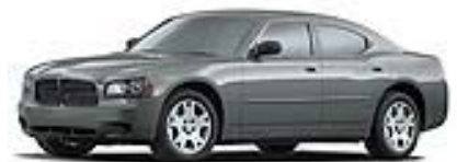
Silver Steel met.