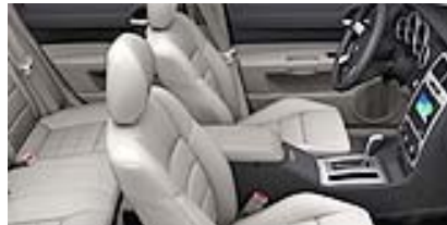
Slate Gray Light Graystone, Leder