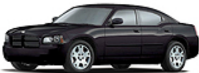
Brilliant Black Crystal Pearl