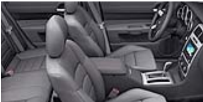
Dark/Light Slate Gray, Leder