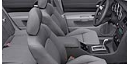
Slate Gray Light Graystone, Stoff