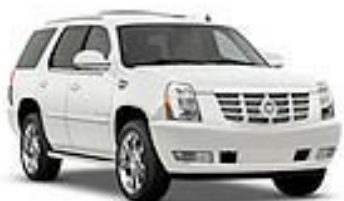
White Diamond (Aufpreispflichtig)